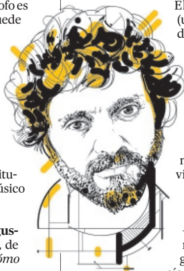
ILUSTRACIÓN DE SETANTA