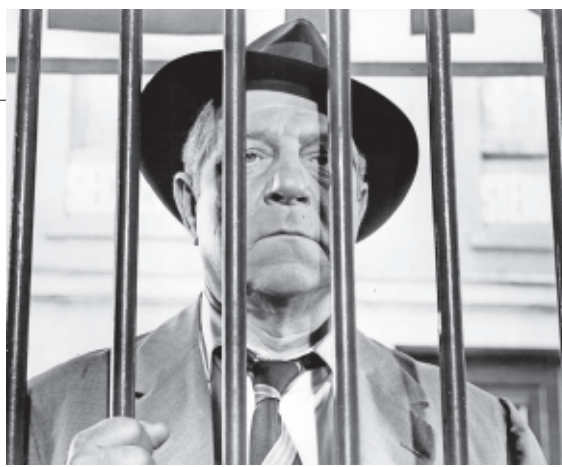
Jean Gabin, en El comisario Maigret .

rá en 2122, cuando ustedes —y, quizás, yo— estén criando malas). Pero eso es lo de menos: lo importante es que, a su vez, el guarismo del año en que nos va a tocar vacunarnos (en fin, aún no está claro) es, sobre todo, el resultado del producto de dos números primos también consecutivos ( 43 \times 47 = 2021 ), lo que constituye una rareza aún más estafalaria que la conjunción de tres planetas, o que el emérito se sume entusiasmado a cierta corriente de opinión favorable a la República. El interés de los matemáticos por los números primos se remonta a las tablillas mesopotámicas, aunque Euclides fue el primero que comprendió su naturaleza infinita. Ignoro si la “grandeza” atribuida a la primalidad del año en curso conlleva algo bueno o nefasto, pero lo cierto es que, hoy por hoy y con los restos del turrón aún sin consumir, los contagios subiendo, me-