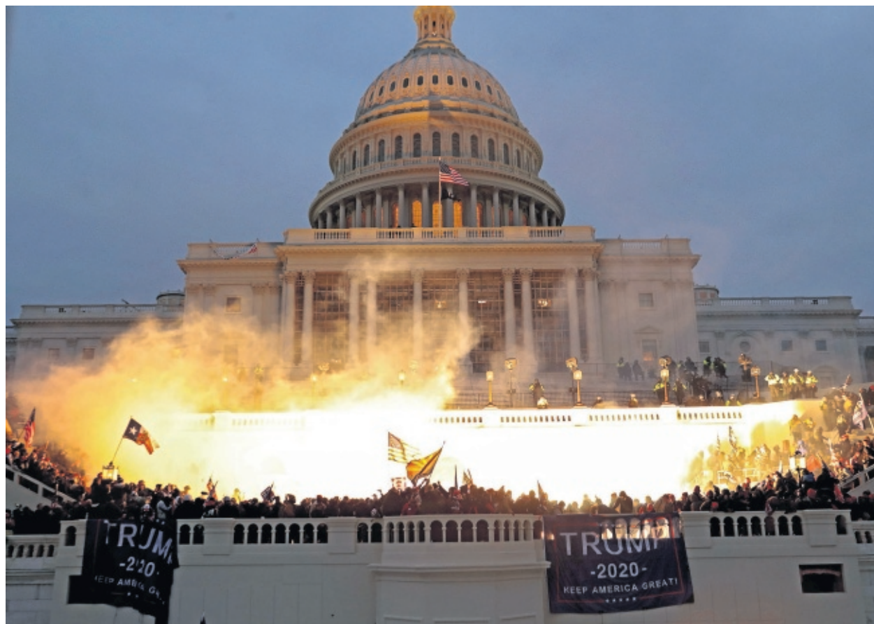
Disturbios provocados por los partidarios de Trump, este miércoles en el Capitolio, en Washington.