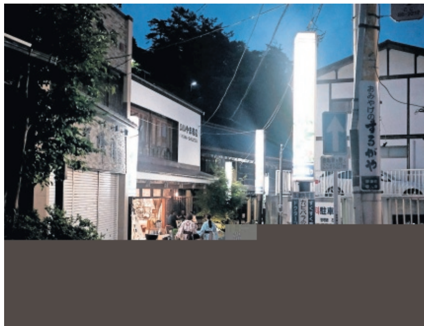
A la izquierda, Hideo Yokoyama, en 2020. Sobre estas líneas, calle de Gunma, lugar de residencia del novelista.

R. Mi objetivo era establecer el referente de la novela policiaca procesal en Japón; analizar la relación entre el protagonista y el delito, su entorno de trabajo, sus fricciones con la organización para la que trabaja y, a partir de ahí, los elementos más perjudiciales de la sociedad japonesa en general, porque estoy convencido de que escribir sobre individuos sigue siendo escribir sobre la sociedad. Mi intención era aportar un debate con fundamento para cualquier persona que quisiera ser reportero, periodis-