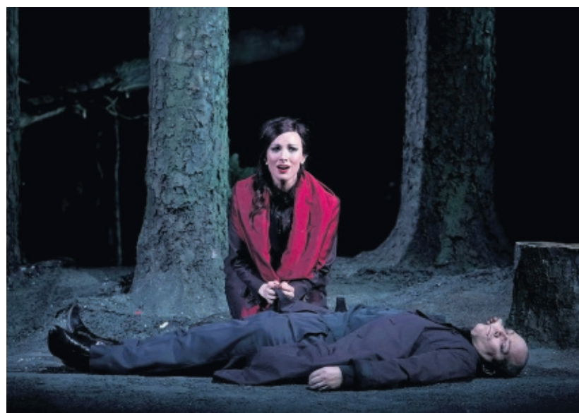
Representación de Don Giovanni en el Teatro Real de Madrid.

Desde el Romanticismo, Don Giovanni tuvo un resplandor de héroe solitario que se salta todas las con-