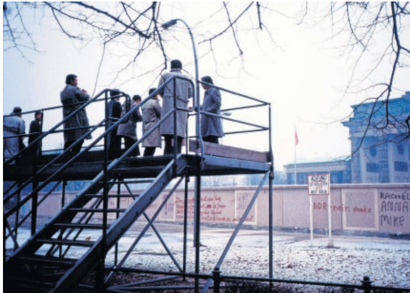
Ciudadanos de Berlín Oeste miran al Este en 1988.

Poco antes de morir, Christa Wolf escribió August , un relato magistral en el que pasado y presente se entrelazan